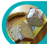
Gâteau banane et noix