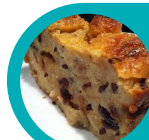
Pudding au pain et aux raisins secs