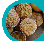
Muffin aux pommes