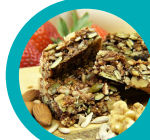
Barre de céréales

Retrouvez ces recettes rédigées pour 20 élèves de classe élémentaire dans le livret annexé à ce guide. Il conviendra d'ajuster les grammages en fonction de l'âge des convives.