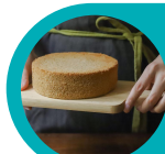
Gâteau au yaourt