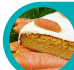
Cake aux carottes